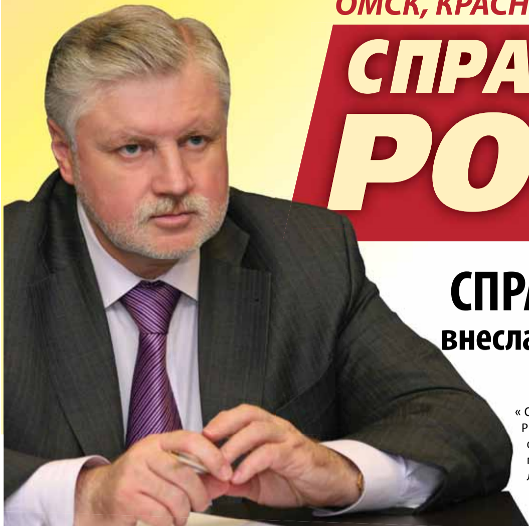
Лидер партии СПРАВЕДЛИВАЯ РОССИЯ Сергей МИРОНОВ