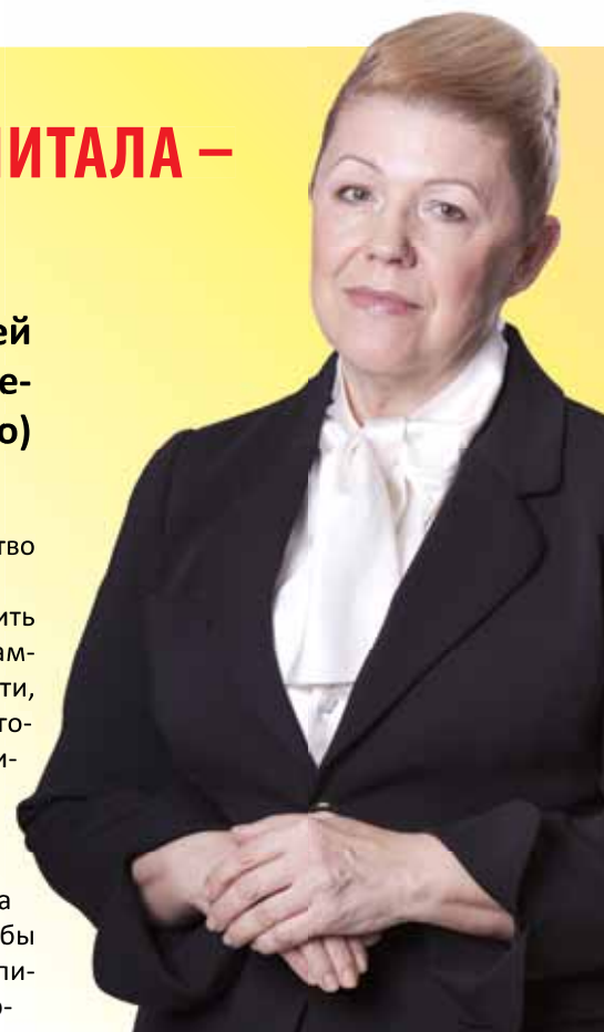
Председатель Комитета Госдумы по вопросам семьи, женщин и детей Елена МИЗУЛИНА

Мы, наоборот, уже несколько лет предлагаем расширить направления использования материнского капитала в рамках улучшения жилищных условий населения. В частности, например, разрешить направлять эти средства на благоустройство дома, на обустройство водопровода, канализации... Потому что это — весьма затратные вещи, но совершенно очевидно, что наличие в доме тепла, водопровода, канализации — безусловное улучшение жилищных условий, способное положительно повлиять на решение семьи обзавестись ребенком. Логичным было бы разрешить семьям направлять средства материнского капитала на ремонт дома, ремонт квартиры, поскольку это позволило бы очень многим семьям рационализировать и обновить жилье».