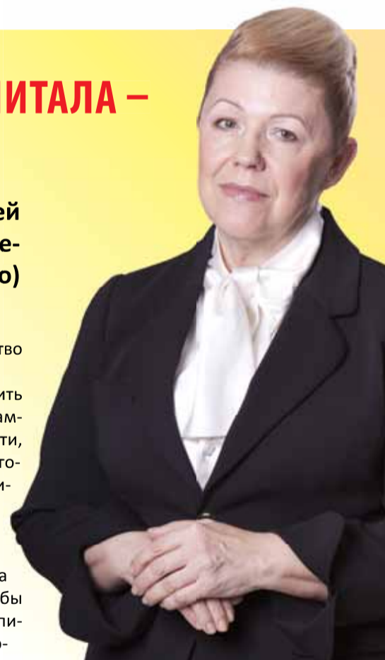
Председатель Комитета Госдумы по вопросам семьи, женщин и детей Елена МИЗУЛИНА

Мы, наоборот, уже несколько лет предлагаем расширить направления использования материнского капитала в рамках улучшения жилищных условий населения. В частности, например, разрешить направлять эти средства на благоустройство дома, на обустройство водопровода, канализации... Потому что это — весьма затратные вещи, но совершенно очевидно, что наличие в доме тепла, водопровода, канализации — безусловное улучшение жилищных условий, способное положительно повлиять на решение семьи обзавестись ребенком. Логичным было бы разрешить семьям направлять средства материнского капитала на ремонт дома, ремонт квартиры, поскольку это позволило бы очень многим семьям рационализировать и обновить жилье».