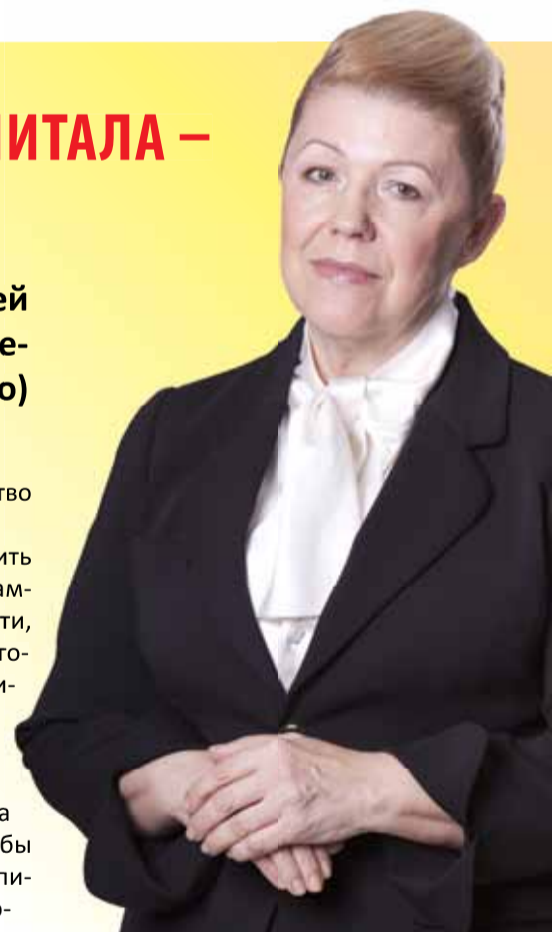
Председатель Комитета Госдумы по вопросам семьи, женщин и детей Елена МИЗУЛИНА

Мы, наоборот, уже несколько лет предлагаем расширить направления использования материнского капитала в рамках улучшения жилищных условий населения. В частности, например, разрешить направлять эти средства на благоустройство дома, на обустройство водопровода, канализации... Потому что это — весьма затратные вещи, но совершенно очевидно, что наличие в доме тепла, водопровода, канализации — безусловное улучшение жилищных условий, способное положительно повлиять на решение семьи обзавестись ребенком. Логичным было бы разрешить семьям направлять средства материнского капитала на ремонт дома, ремонт квартиры, поскольку это позволило бы очень многим семьям рационализировать и обновить жилье».