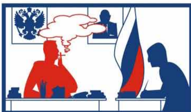
в помещениях, занятых органами государственной власти, органами местного самоуправления;