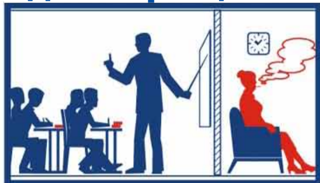
на территориях и в помещениях, предназначенных для оказания образовательных услуг, услуг учреждениями культуры и учреждениями органов по делам молодежи, услуг в области физической культуры и спорта;