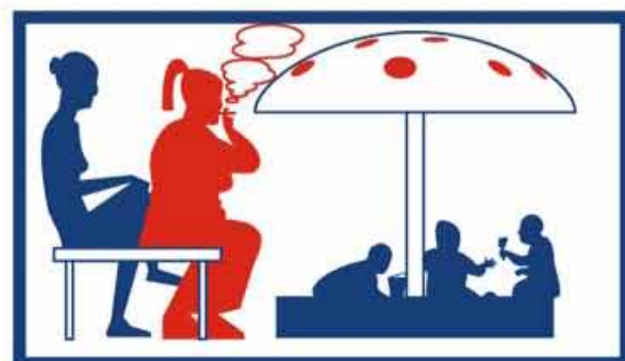
на детских площадках и в границах территорий, занятых пляжами;