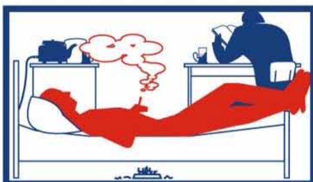
в помещениях, предназначенных для предоставления жилищных услуг, гостиничных услуг, услуг по временному размещению и (или) обеспечению временного проживания;