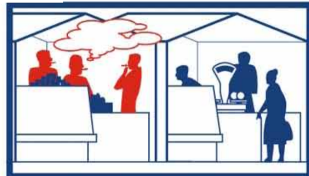
в помещениях, предназначенных для предоставления бытовых услуг, услуг торговли, общественного питания, помещениях рынков, в нестационарных торговых объектах;