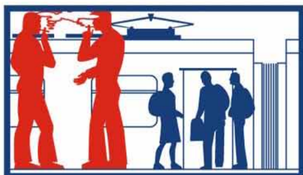
на пассажирских платформах, используемых исключительно для посадки в поезда, высадки из поездов пассажиров при их перевозках в пригородном сообщении;