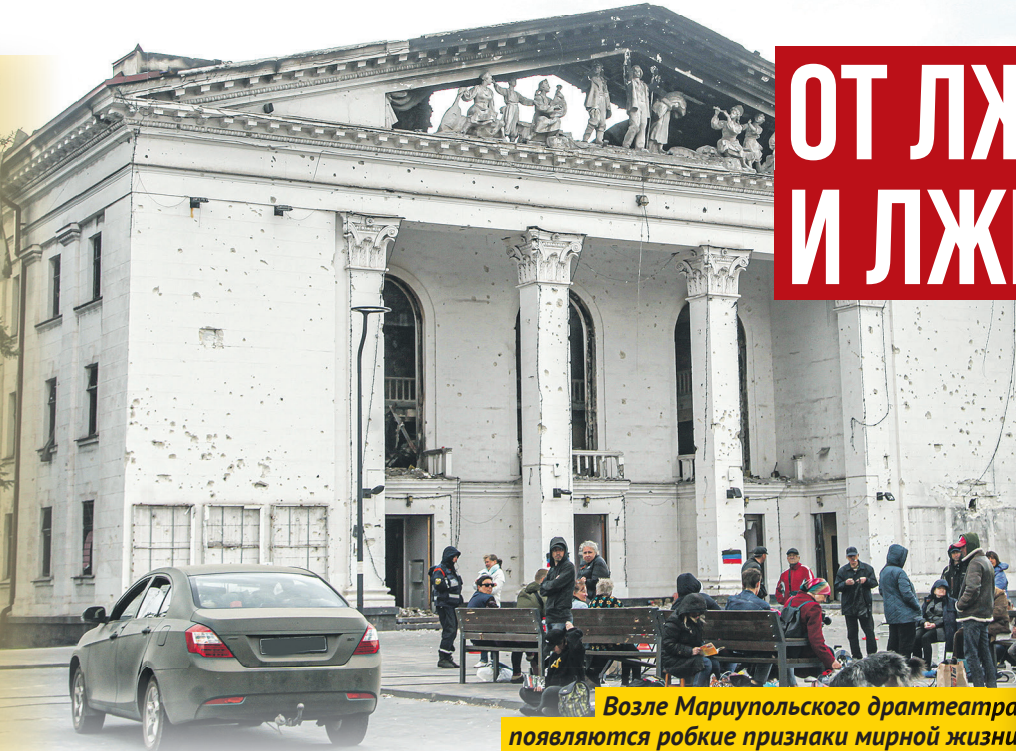
Возле Мариупольского драмтеатра появляются робкие признаки мирной жизни