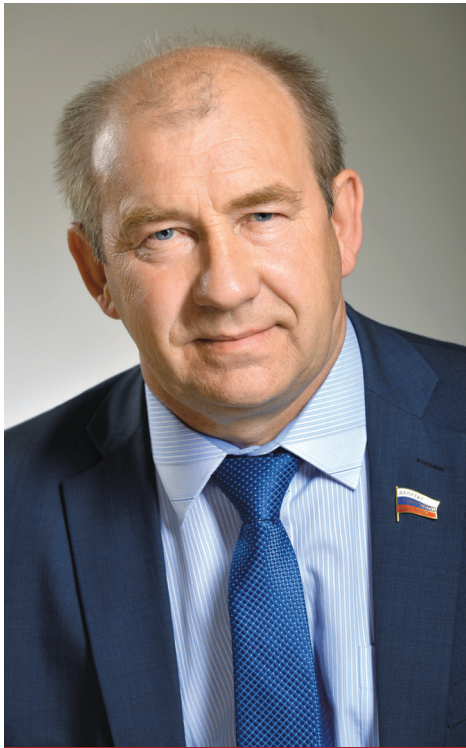
Депутат Государственной Думы ФС РФ Александр КРАВЦОВ