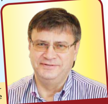
Депутат Законодательного Собрания Омской области Евгений Дубовский

В отличие от Омска, 26 других муниципальных образований региона уже получили деньги из Фонда ЖКХ и занимаются капремонтом своих 113 многоквартирных домов.