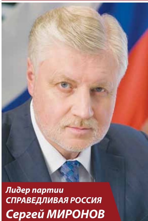
Лидер партии СПРАВЕДЛИВАЯ РОССИЯ Сергей МИРОНОВ

Лидер партии СПРАВЕДЛИВАЯ РОССИЯ Сергей Миронов прокомментировал законопроект о внесении изменений в Федеральный закон «О трудовых пенсиях в Российской Федерации», внесенный им на рассмотрение Государственной Думы совместно с депутатами Николаем Левичевым и Оганесом Оганяном: