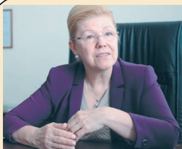
Депутат Государственной думы Федерального собрания Российской Федерации Елена МИЗУЛИНА:

Также предусматриваются различные меры социальной поддержки: внеочередное оказание медицинской помощи в федеральных и региональных медицинских организациях; льготы по оплате жилых помещений и коммунальных услуг.