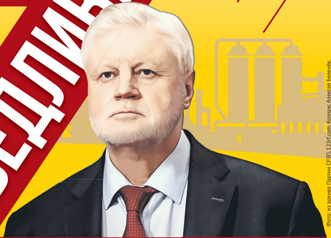
Фото: из архива Партии СРЭП, 123rf.com. Коллаж: Алексей Беленёв.

Как именно Омская область может преодолеть последствия санкций?