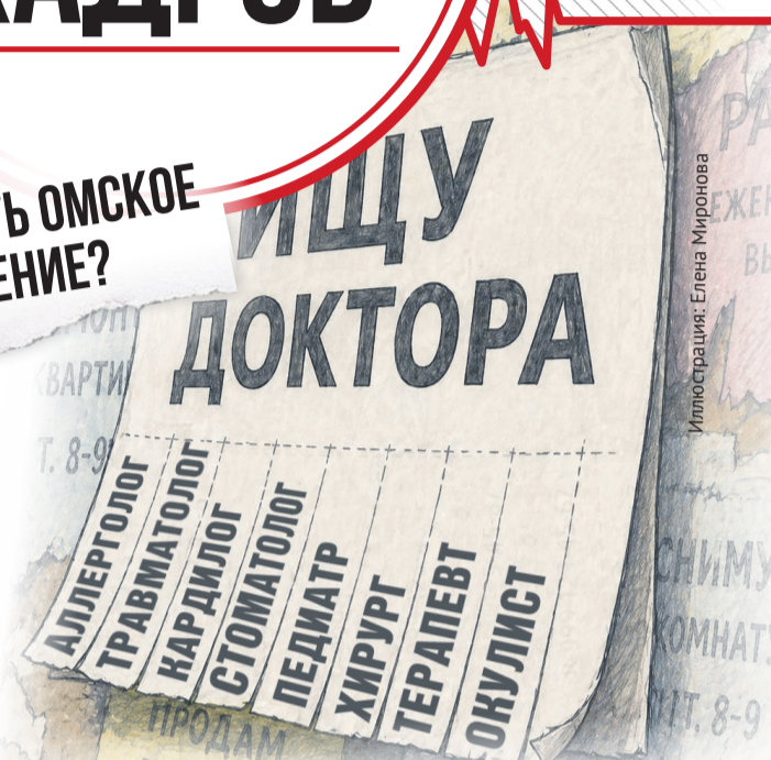
Иллюстрация: Елена Миронова

ВЛАДИМИР ГУСЕЛЕТОВ