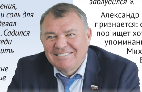
АЛЕКСАНДР РЕМЕЗКОВ

Так и повелось в семье Ремезковых. Сначала «С днем рождения, дед», потом «С Днем Победы».