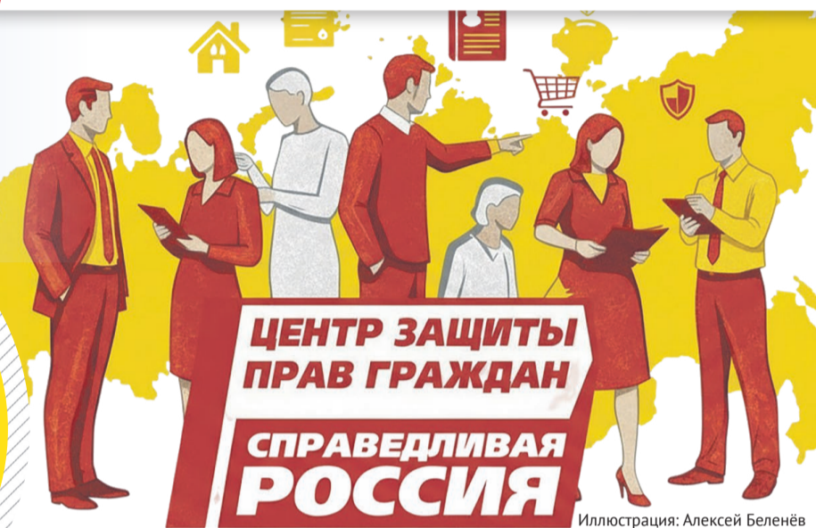
Иллюстрация: Алексей Беленёв

Как вернуть ребенка, которого пытается отобрать бывший супруг? Как заставить соседа, по вине которого сгорело ваше имущество, возместить ущерб? И можно ли взыскать компенсацию за скачок напряжения, из-за которого пришлось выбросить холодильник? На эти и многие другие вопросы всегда готовы ответить в Центре защиты прав граждан Партии СПРАВЕДЛИВАЯ РОССИЯ в Омской области. Квалифицированно, эффективно и совершенно бесплатно