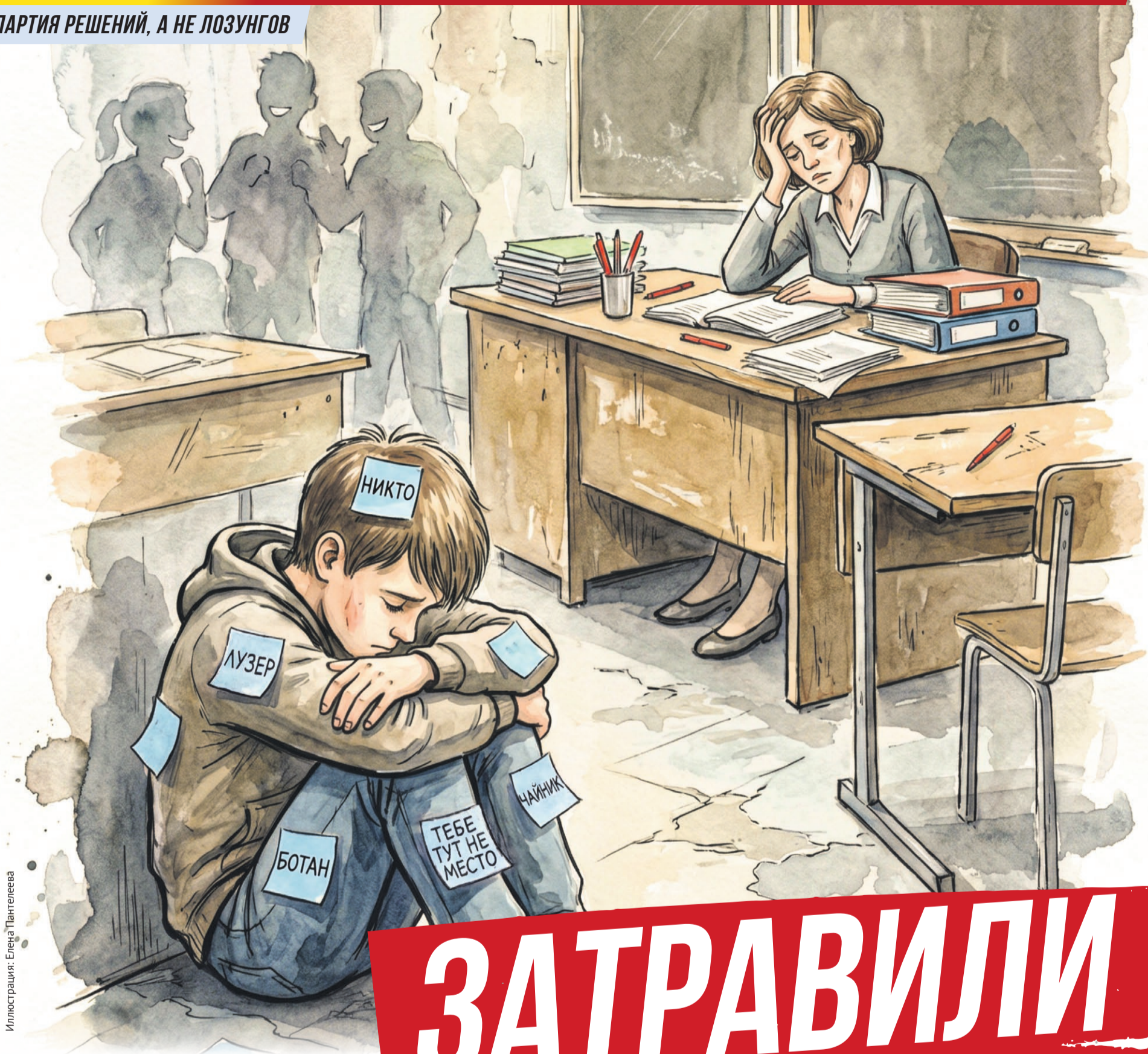
Иллюстрация: Елена Пантелеева